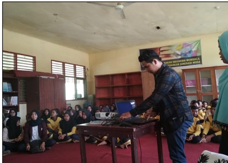
Gambar 2. Presentasi Materi

Adapun jumlah peserta yang mengikuti kegiatan ini lebih kurang 50 orang siswa-siswi. Materi kegiatan berupa materi pengetahuan mengenai pengaruh perkembangan teknologi terhadap kehidupan sosial remaja secara kualitatif. Pada akhir pertemuan, pengabdian ini dilanjutkan oleh guru dan wali kelas.