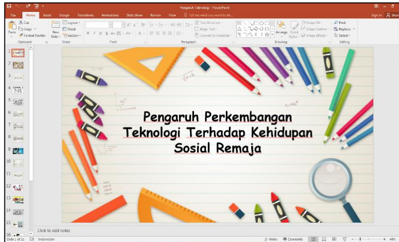
Gambar 3. Materi Presentasi