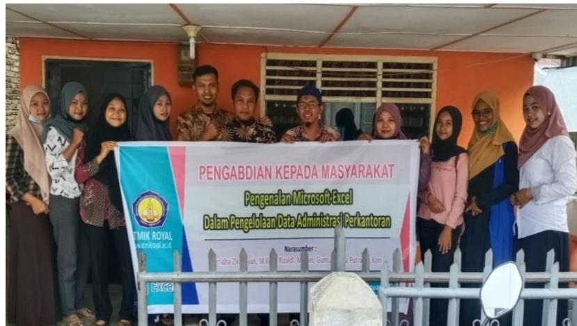
Gambar 1. Para Peserta Pelatihan Excel LKP Pelita Media

Pada gambar di bawah ini adalah foto dokumentasi dalam kegiatan pengabdian kepada masyarakat yang dilakukan di LKP Pelita Media di Kisaran. .