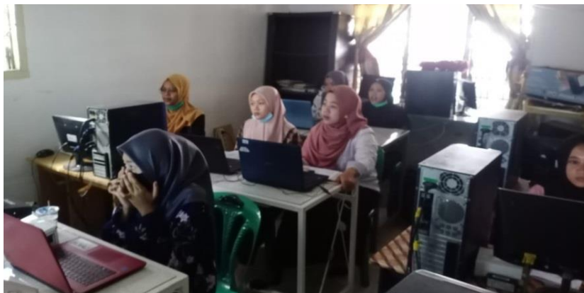
Gambar 3. Foto Pelatihan Peserta di LKP Pelita Media