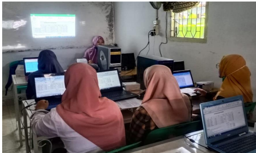
Gambar 2. Pengenalan Komputer Pada Peserta LKP Pelita Media